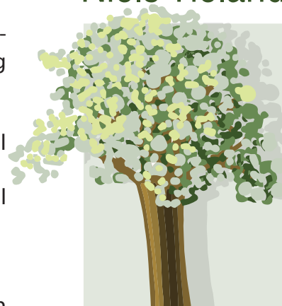
grafisch ontwerp illustraties webontwerp

nielstieland.nl bewaart uw persoonsgegevens niet langer dan strikt nodig is om de doelen te realiseren waarvoor uw gegevens worden verzameld. Wij hanteren de volgende bewaartermijn: zo lang als nodig om u van dienst te kunnen zijn.